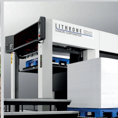
Tuotantoteollisuus / teollisuuden laitteet