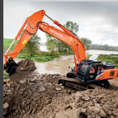
Rakentaminen ja raskaat koneet ja laitteet